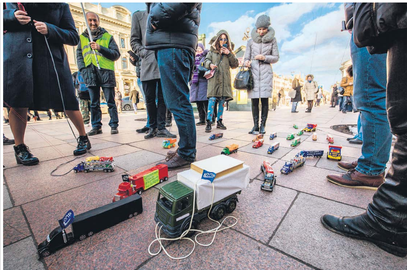
Участники рынка автоперевозок сомневаются в эффективности будущей системы их регистрации

В пояснительной записке говорится об отсутствии должного контроля за грузовыми перевозками, где растет число ДТП, после того как в 2009 году было отменено лицензирование, и компания мо-