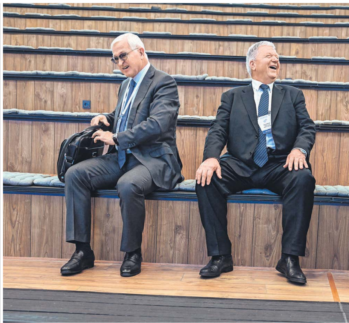
Глава РСПП Александр Шохин и глава ФНПР Михаил Шмаков давно стали сямскими близнецами

Профсоюз работников авиационной промышленности назвал свой стенд просто и емко: «От съезда к съезду» (мысль, впрочем, красивой нитью, стежком вышитой от стенда к стенду). Именно так, от съезда к съезду, и живут профсоюзы. Именно на съездах, а не между ними, их лидеры поднимают головы. Это их время. Время действовать. Так было и в советский период, которому они были нужны, чтобы трудящиеся всегда могли быть уверенными, что