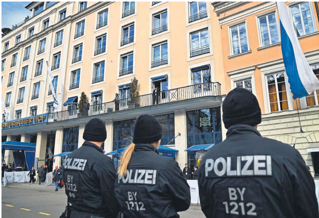
В пятницу в фешенебельном баварском отеле Bayerischer Hof откроется юбилейная, 60-я Мюнхенская конференция по безопасности.

На этой неделе открывается Мюнхенская конференция по безопасности — один из самых известных в мире форумов по вопросам внешней политики и обороны, отмечающий в этом году 60-летие. Ожидается, что на полях мероприятия будет заключено соглашение об укреплении сотрудничества в сфере безопасности между Германией и Украиной. По данным немецких СМИ, с украинской стороны его подпишет президент Владимир Зеленский, который планирует лично выступить на конференции. Между тем, как следует из опубликованного вчера организаторами форума аналитического доклада, граждане Германии, как и большинства других стран G7, более не считают Россию главной угрозой для своих государств.